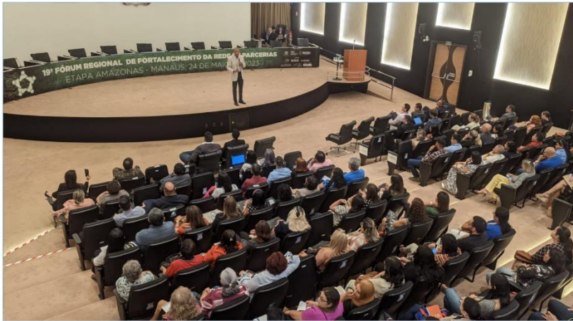
Evento foi realizado no auditório da Corte de Contas amazonense.

Encontro teve como objetivo aprimorar a gestão de parcerias públicas no AM