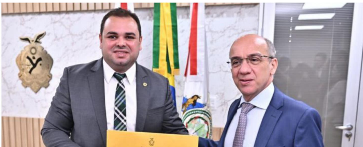
Os presidentes da Assembleia Legislativa do Amazonas e do Tribunal de Contas do Estado, Roberto Cidade e Érico Desterro, respectivamente

P ara tornar possível a instituição do ‘Programa de Residência Jurídica e Contábil do Tribunal de Contas do Amazonas’ (TCE-AM), o conselheiro-presidente Érico Desterro entregou aos deputados da Assembleia Legislativa do Amazonas (Aleam), na manhã desta terça-feira (11), o anteprojeto de lei para ser apreciado. A Corte de Contas deve, agora, aguardar apreciação e aprovação dos deputados sobre o programa para que então seja autorizada a elaboração de um Processo Seletivo.