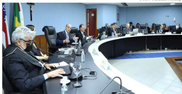
Colegiado do Tribunal de Contas do Estado do Amazonas reunido no Plenário Elphego de Souza

Na auditoria foram analisados a Ouvidoria, a Secretaria de Controle Externo (Secex), a Diretoria de Comunicação (Dicom), o Departamento de Gestão de Pessoas (Degesp), Departamento de Auditoria Operacional (Deaop), Departamento de Planejamento (Deplan), o Departamento de Informações Estratégicas, e as áreas de saúde, educação, transparência pública, e estrutura de gabinetes de conselheiros, auditores e procuradores.